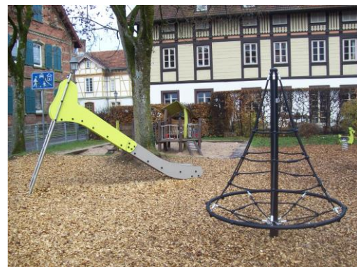
Neugestaltung Spielplatz Neckarstraße 20.000 €