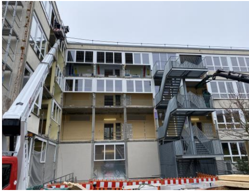
Generalsanierung Schule/Einbau eines Schulkindergartens 4,3 Mio. € 2020: 1,4 Mio. €