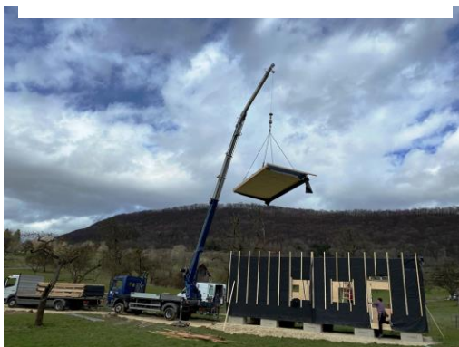
Naturkindergarten 80.000 €