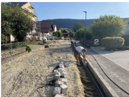
Sanierung Bach- und Johann-Strauß-Straße, Wasserleitung und Belag 400.000 €