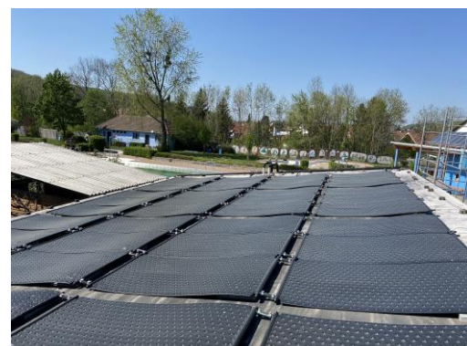
Sanierung Solarheizung und Sanitärbereich Freibad 70.000 €