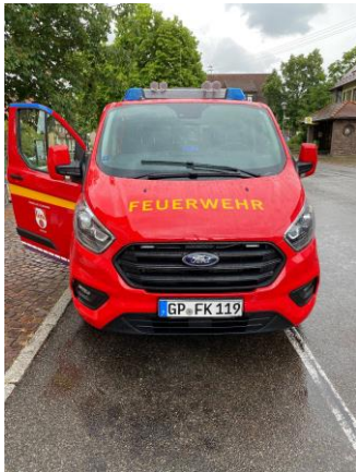
Neuer Mannschafts-Transportwagen FFW Kuchen, 52.000 €