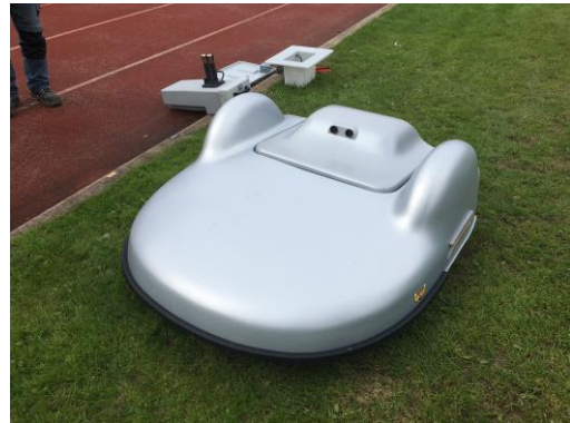
Anschaffung Mähroboter für das Sportzentrum Anken, 22.000 €