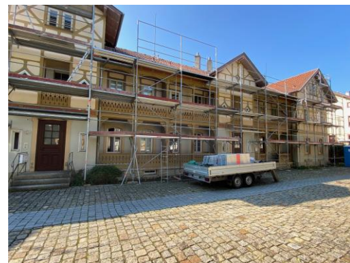
Malerarbeiten Bleicherstr. 19 80.000 €