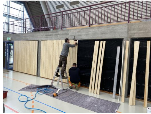
Beginn Sanierung Ankenhalle ges. 3,2 Mio. €