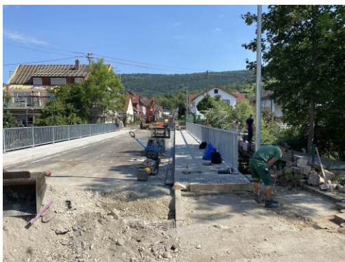
Sanierung Filsbrücke Filsstraße 400.000 €