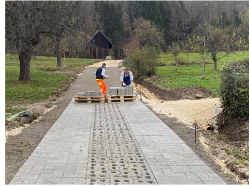
Feldwegsanierung Kleingartenanlage „Pferch“ 79.000 €