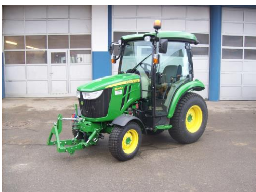
Neuer Kompakttraktor Bauhof 45.000 €