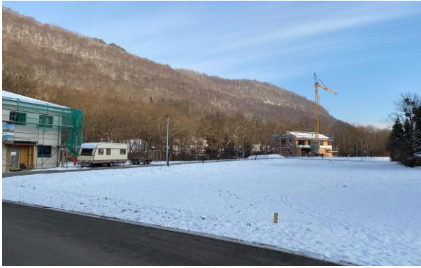
Baugebiet „Kirschwiesen“ 200.000 €