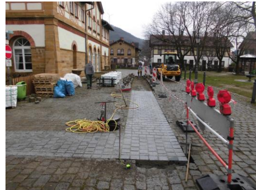
Barrierefreier Pflasterbelagstreifen SBI-Festplatz 45.000 €